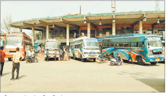
प्रतीक्षा बस स्टैंड में खड़ी यात्री बसें।

शहर के अन्तर्ज्यीय प्रतीक्षा बस स्टैंड से जिले सहित दूसरे शहर व जिलों से