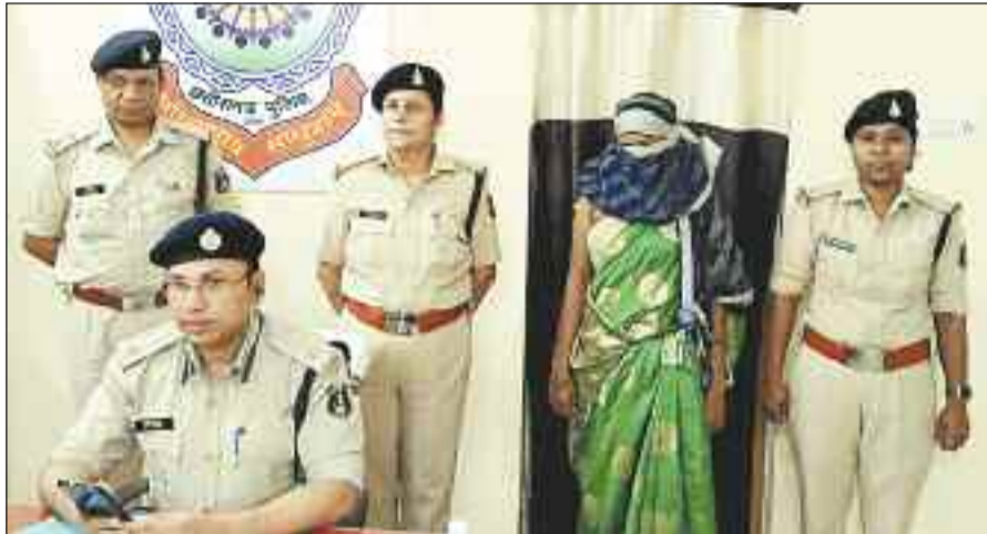
पुलिस गिरफ्त में आरोपी महिला।

उसके नाती का करीब 7-8 वर्ष पूर्व में एक्सडिट से मृत्यु हो गई एवं नाती की पत्नी ने अपने पति के देहांत होने के बाद दूसरी जगह शादी कर घर बसा ली। प्रार्थी के नाती के 3 बच्चे हैं, सबसे बड़ी लड़की उम्र 14 साल, मंझली लड़की 12 साल एवं सबसे छोटा लड़का की उम्र 10 साल का है। बड़ी लड़की कक्षा 6वीं तक पढ़ाई करके पढ़ाई छोड़ दी है। उक्त तीनों बच्चे प्रार्थी के बड़े भाई की जन्म से अभावित हैं उन्हीं के घर में रहते हैं, प्रार्थी एवं परिवार के लोग बीच-बीच में जाकर बच्चों को देख-रेख करते हैं। दिनांक 12.04.2024 को शाम लगभग 04 बजे प्रार्थी बकरी चराकर वापस अपने घर में आया तो उसकी बहू ने